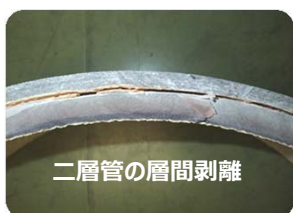
二層管の層間剥離